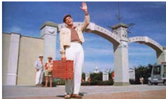
Le show de Truman