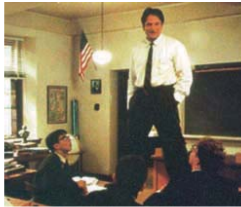
La société des poètes disparus