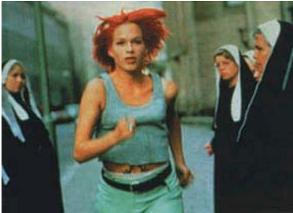
Cours, Lola, cours