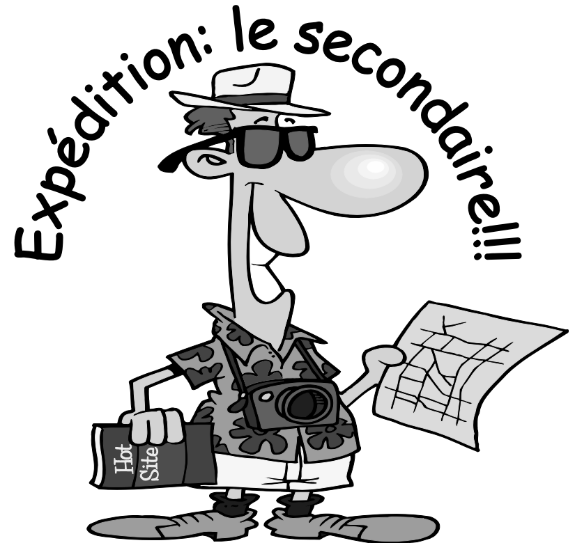
Fait par Manon Comtois, Commission scolaire de Saint-Hyacinthe