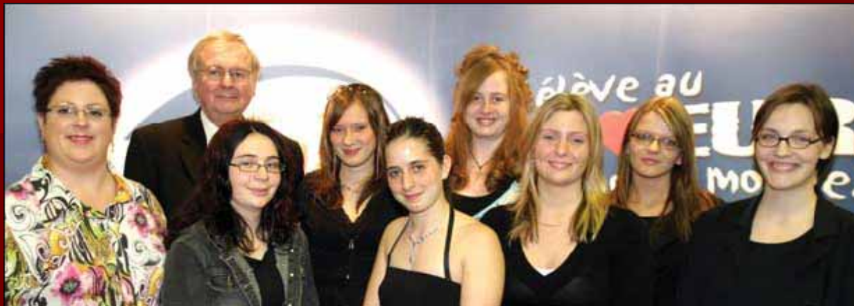
La coopérative étudiante le Dep-Explo

École secondaire Vanier – Catégorie secondaire général (collectif)